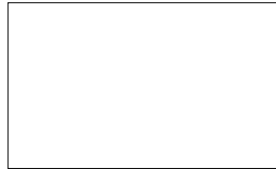
WEISS (RAL 9016)