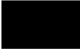
SCHWARZ (RAL 9005)