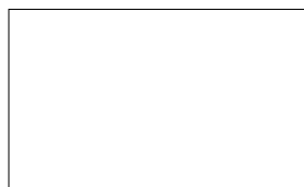
WEISS (RAL 9016)